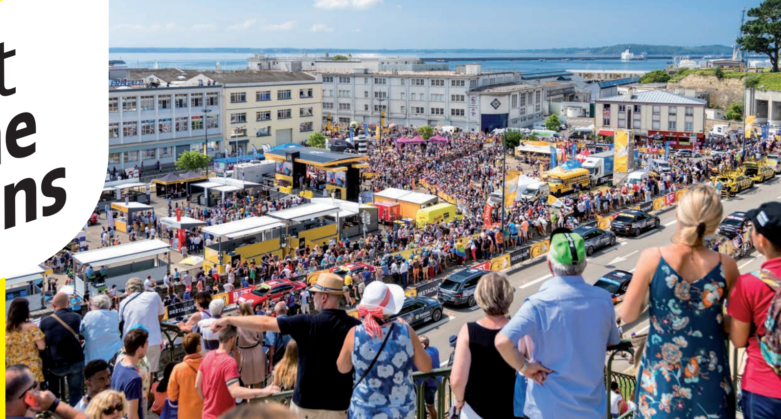
Le public au départ du Tour de France 2018 à Brest